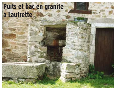
Puits et bac en granite à Lautrette

7 Au croisement, prendre à droite, traverser le ruisseau de l'étang du Mas Nadaud, qui coule près d'une motte féodale, puis remonter vers la route. La traverser et suivre en face le chemin qui ramène à la Grande Veyssière. Reprendre le circuit à gauche pour revenir au point de départ.