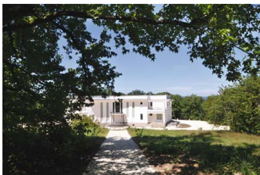
La villa Monteux, à la Texonnière