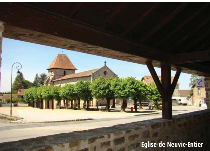
Eglise de Neuvic-Entier

10 Traverser la route et continuer en face sur le chemin en terre. A la route, aller tout droit et rejoindre le bourg de Neuvic-Entier. Prendre la route en face, à gauche du garage et continuer jusqu'à la place de l'église, point de départ du circuit.