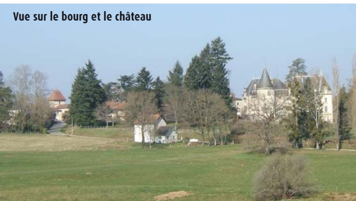
Vue sur le bourg et le château