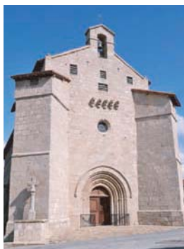
Façade de l'église de Blond

Un escalier en vis étroit et obscur permet d'accéder au clocher. Celui-ci est un véritable donjon qui met en scène divers systèmes défensifs : une bretèche de pierres soutenue par cinq corbeaux restés en façade, trois réduits défensifs ouverts de baies de tirs et de canonnières et un chemin de ronde composé d'une dizaine de baies de tir et de guet qui contrôlent les toits des maisons avoisinantes. Les murs