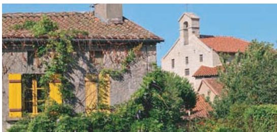
Bourg de Blond

Le Rocher de l'Amour à Blond ressemble à un organe génital féminin. Les femmes désirant un enfant se frottent le nombril sur la pierre et font un vœu.