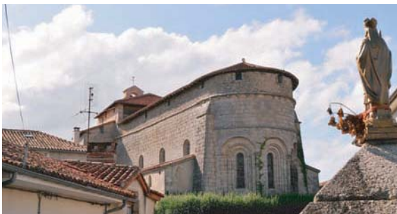
Eglise fortifiée de Blond