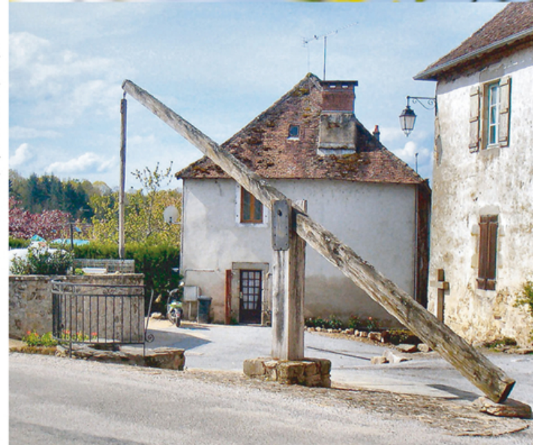
Ne pas jeter sur la voie publique

VICQ-SUR-BREUILH Circuit "les coteaux de la Breuilh" 3 h 30 - 14 km