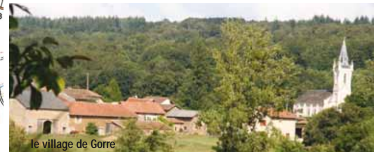
le village de Gorre