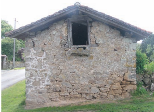
Clédier à Boubon