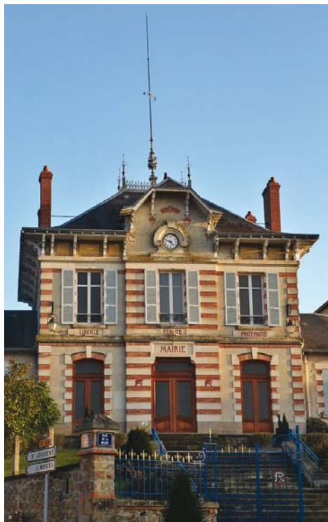
Mairie de Peyrilhac

12 Aller tout droit en admirant sur votre gauche le domaine de la Mothe. Arriver à Peyrilhac.