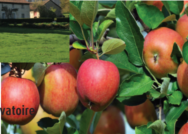
le verger conservatoire