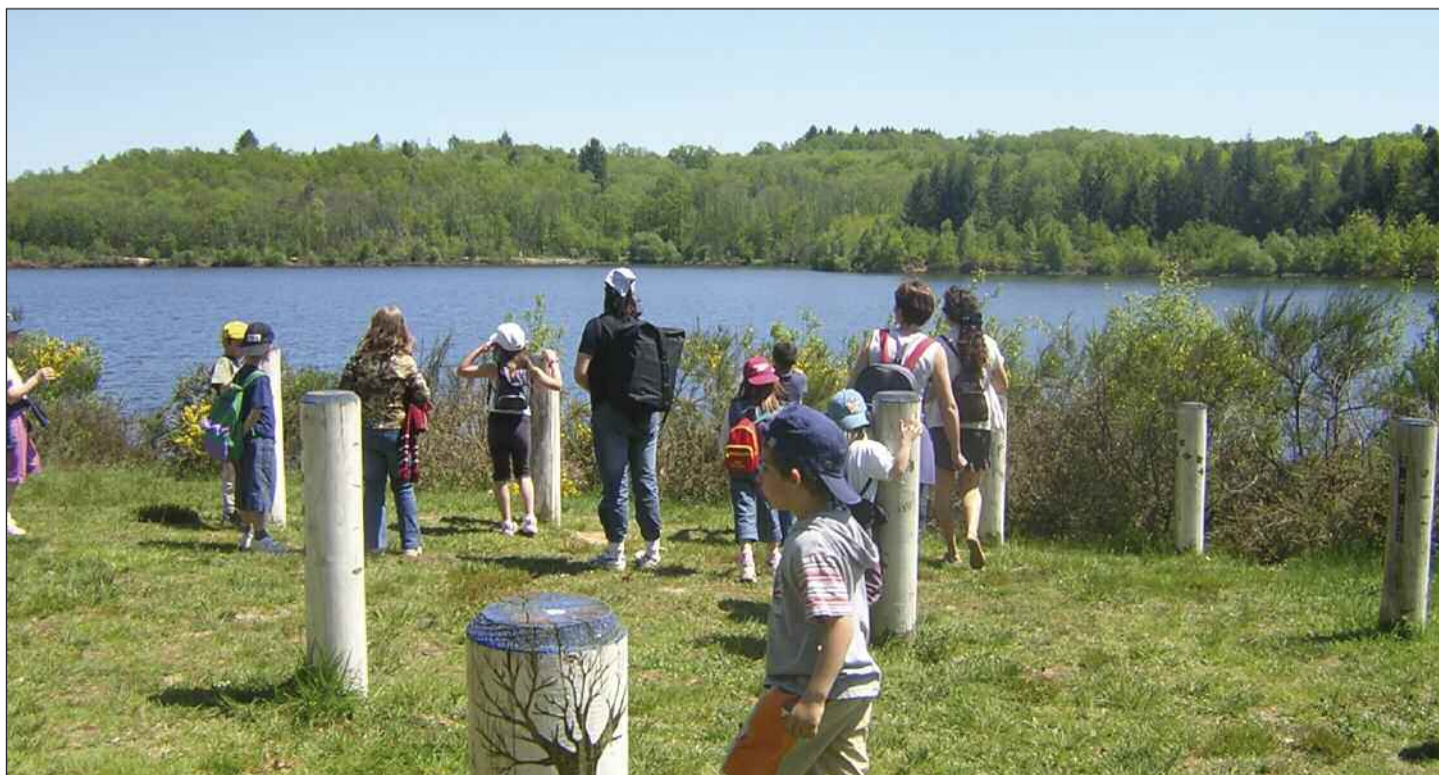
Barrage de Miallet