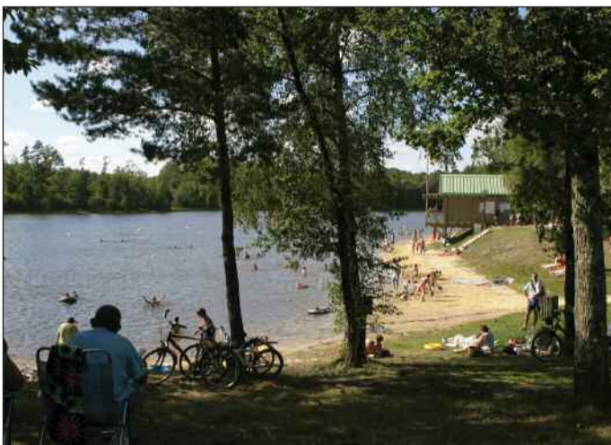
Grand étang de Saint Saud Lacoussière

Eglises (se renseigner auprès des Mairies)