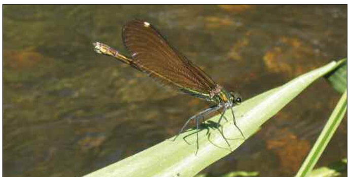
Calopteryx vierge femelle

Renseignements : Syndicat d'Initiative de Saint Pardoux la Rivière Tél. : 05 53 56 79 30