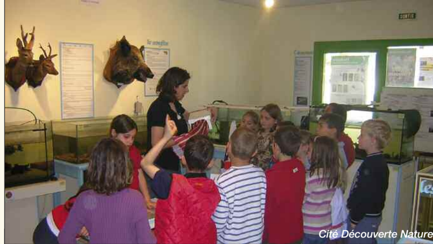
Cité Découverte Nature