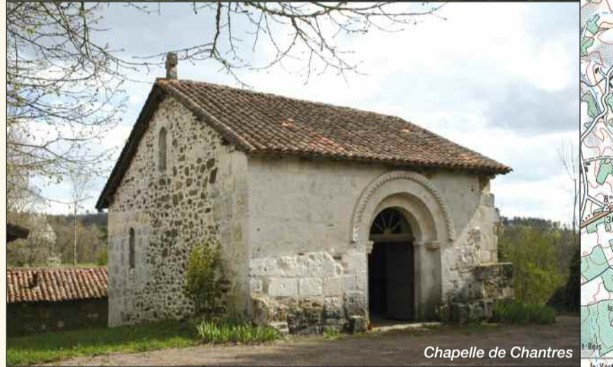
Chapelle de Chantres