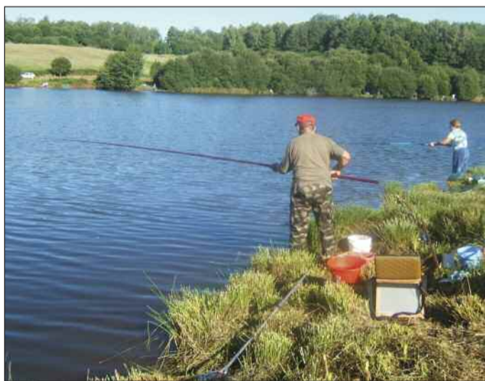
Pêche au barrage de Miallet

FIRBEIX ETANG COMMUNAL Renseignements : Mairie Tél. : 05 53 52 82 51