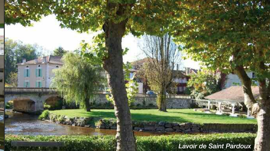
Lavoir de Saint Pardoux