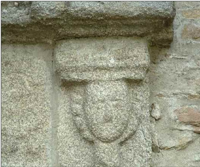
Eglise de Miallet