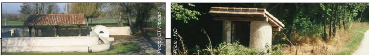
* A voir en chemin : Fontaines, puits et lavoirs du Ribéracois sur les boucles 1 - 2 - 4 - 7

* AVERTISSEMENT : Ces informations sur la nature du revêtement n'ont qu'une valeur indicative. Elles sont destinées à faciliter la lecture de la carte IGN. L'urbanisation et l'activité humaine peuvent conduire à de significatives transformations du paysage et modifier le tracé ou le revêtement des itinéraires. Ces évolutions incombent aux responsables du C.D.T.