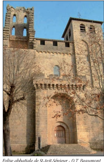
Eglise abbatiale de St-Avit-Sénieur - O.T. Beaumont.